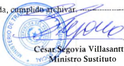
César Segovia Villasanti Ministro Sustituto