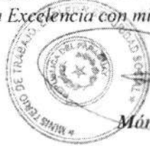
Mónica Recalde De Giacomi Ministra

Sin otro particular, y agradeciendo de antemano su colaboración, hago propicia la ocasión para saludar a Vuestra Excelencia con mi más distinguida consideración.