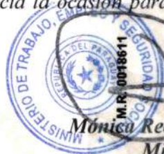
Mónica Recalde De Giacomi Ministra

Sin otro particular, hago propicia la ocasión para saludarle con mi más distinguida consideración.