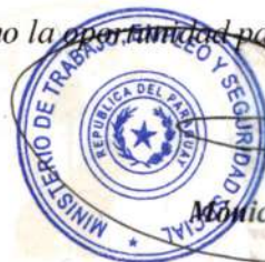
Mónica Recalde De Giacomi Ministra

Sin otro particular, aprovecho la oportunidad para renovar a usted las seguridades de mi más alta consideración.