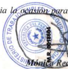
Mónica Recalde De Giacomi Ministra

Sin otro particular, hago propicia la ocasión para saludarle con mi más distinguida consideración.